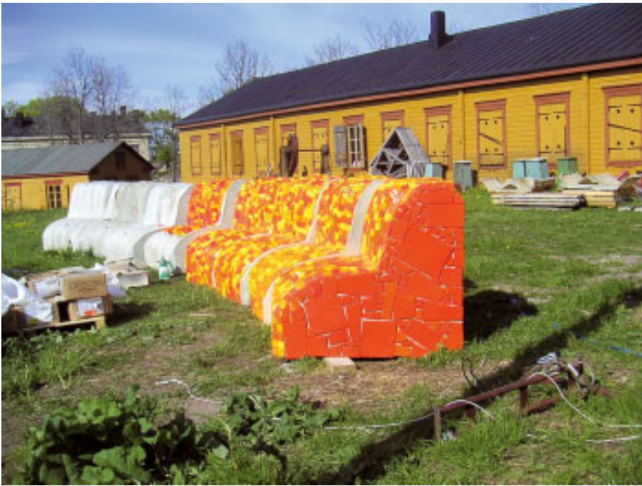
Marja Kolu 4