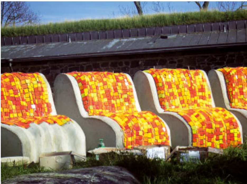
Marja Kolu 5